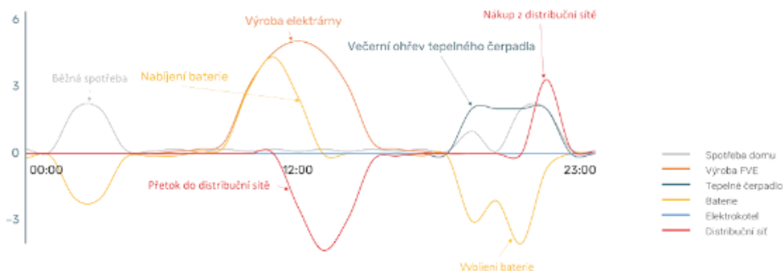
Obr. 1 • Výroba a spotřeba energie RD v průběhu jarního dne