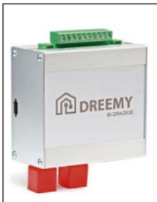
■ Chytré zařízení Dreemy

Jak efektivně zkombinovat fotovoltaickou elektrárnu s tepelným čerpadlem? Pomocí nadřazeného řídicího systému